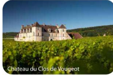
Chateau du Clos de Vougeot

今天 (9:30AM - 6PM)，繼續由專業葡萄酒嚮導帶領前往以出產優質黑比諾 (Pinot Noir) 而聞名的 Cote de Nuit 夜之丘，途經 Ladoix、nuits St Georges、Vosne Romané、Chambolles Musigny、Fixin 等村莊。參觀特級園 Chateau du Clos de Vougeot (含2種葡萄酒Tasting) 及 Gevrey Chambertin 村莊內其中一個酒莊 (視乎酒莊預約時間安排; 含3種葡萄酒Tasting)。專業葡萄酒嚮導沿途與客人講解布根地葡萄酒產區及交流葡萄酒知識，令客人對夜之丘的出產有更深入的了解。