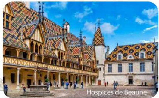
Hospices de Beaune

早餐後乘坐專車前往法國最肥沃、最豐富的布根地葡萄產區內的布蒙 (Beaune)。到達後，客人自行前往歷史悠久的布蒙濟貧醫院博物館 (Hospices de Beaune) 參觀，了解更多中世紀布根地風格建築及認識布根地的酒鄉歷史。