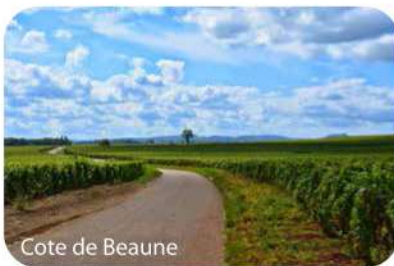
Cote de Beaune