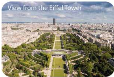
View from the Eiffel Tower

於酒店享用早餐後，當地專業導遊帶領客人遊覽巴黎市內必去景點。登上著名艾菲爾鐵塔 (Eiffel Tower) 觀看巴黎景色及參觀巴黎凱旋門 (Arc de Triomphe)。晚上由專車接送，前往巴黎最著名歌舞表演廳 - 紅磨坊 (Moulin Rouge)，邊看歌舞表演邊享用晚餐。